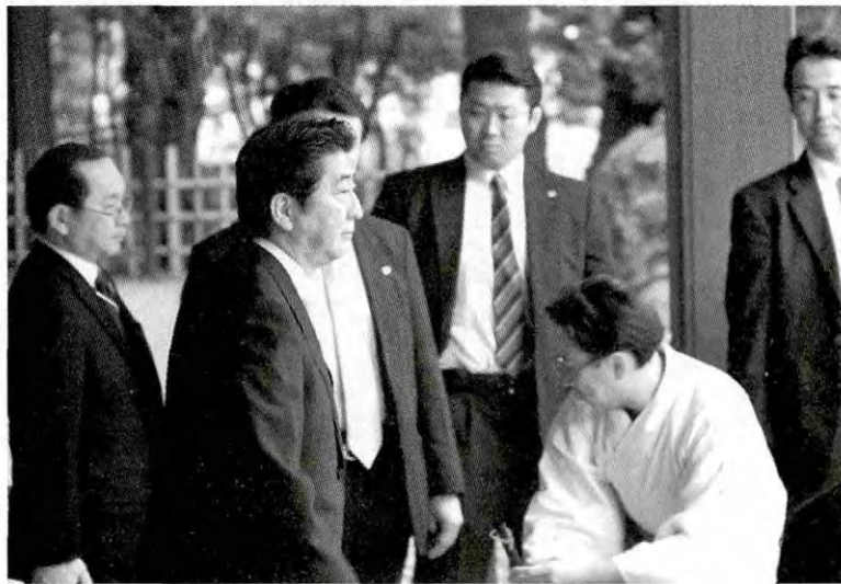
>> 2013年12月26日，日本首相安倍晋三（左二）在执政一周之际，参拜靖国神社。