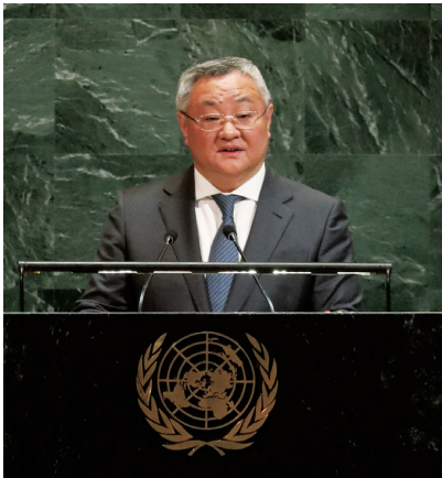
▲ 2025年11月17日，中國常駐聯合國代表傅聰致函聯合國秘書長古特雷斯，指出高市言論的危害，揭露軍國主義死灰復燃跡象，提醒會員國聯合國第2758號決議中對台灣是中國一部分的明確規定。圖為11月18日，傅聰在紐約聯合國總部第80屆聯大全會審議安理會改革問題時發言指出，日本沒有資格要求成為安理會常任理事國

面對中國的多維反制，高市不僅沒有意識到自己的錯誤，甚至採取對抗到底的態度。11月23日，高市和印度總理莫迪會面之後，其態度陡然轉向強硬，她重申日本堅持必要的立場，還反手給中國貼上不願對話的標籤。她繼續聲稱「台灣有事就是日本有事」，甚至暗示會進一步強化對台海局勢的涉入準備。在高市看來，日本只要與印度在東西兩面對華施壓，中國就不能對日本的挑釁採取進一步反制。此時，中國如果不對日本做出清晰反制就不足以震懾高市之流的右翼分子。於是，中國人民解放軍新聞傳播中心主辦的官方客戶端「中國軍號」於23日當天用中日雙語發出了聲明，強調「對日本的歷史罪行進行再清算」，「如果日方一意