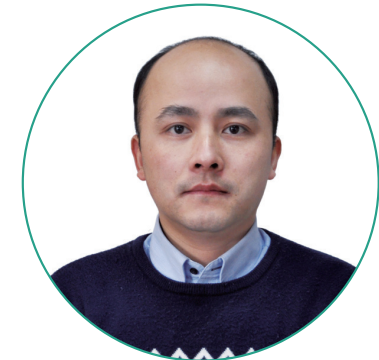
▲ 本文作者陳祥為中國社會科學院日本研究所副研究員

此番高市言行給中國提供了一次展示決心和實力的絕佳機會。中國作為負責任大國，對日本右翼圖謀篡改歷史真相、美化侵略罪行的險惡用心加以果斷、全面的反制，有效打擊其囂張氣焰。高市在2025年12月9日首次公開承認，其此前的涉台言論已對中日關係和日本經濟造成了負面影響，表示將「關注中方措施的影響並妥善應對」。面對外