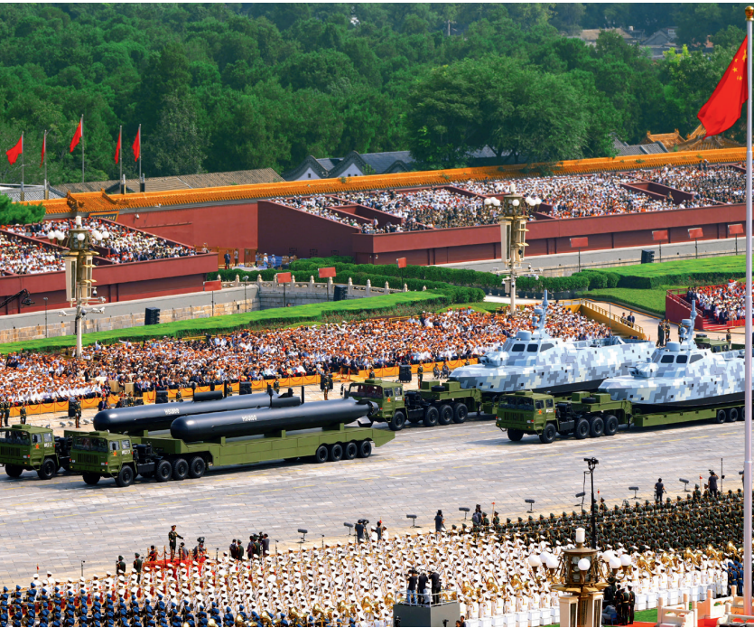
▲ 2025年是中國人民抗日戰爭勝利暨世界反法西斯戰爭勝利80周年。2025年9月3日上午，紀念中國人民抗日戰爭暨世界反法西斯戰爭勝利80周年大會在北京天安門廣場隆重舉行，中共中央總書記、國家主席、中央軍委主席習近平發表重要講話並檢閱受閱部隊。習近平強調：「偉大抗戰精神，是中國人民彌足珍貴的精神財富，將永遠激勵中國人民克服一切艱難險阻、為實現中華民族偉大復興而奮鬥。」

高市多番挑釁言行是日本國內「新軍國主義」勢力抬頭並漸成氣候的表現。他們企圖通過插足台海局勢來煽動日本社會對華敵對情緒，從而鞏固日本社會對他們的支持，同時以此挑戰戰後國際秩序。但是，台灣問題是中國的內政，事關中國核心利益和民族尊嚴，不容任何外來干涉。對於世界來說，中國作為聯合國五常之一，責任之一就是防止日本「新軍國主義」的抬頭。因此，中國深刻意識到，在此次風波中只有堅決、精準的敲打，才能讓日本右翼徹底死心。 2025年是中國人民抗日戰爭勝利暨世