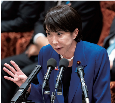
▲ 11月7日，日本首相高市早苗出席國會眾議院預算委員會會議，大談台灣問題，「如果台灣發生緊急事態」，中國大陸對台灣採取軍事行動「可能構成日本可行使集體自衛權的『存亡危機事態』」

日本首相高市早苗是日本右翼政客代表人物之一，她在上任不到1個月，就通過政治冒險多次觸及中國的紅線，將中日關係推