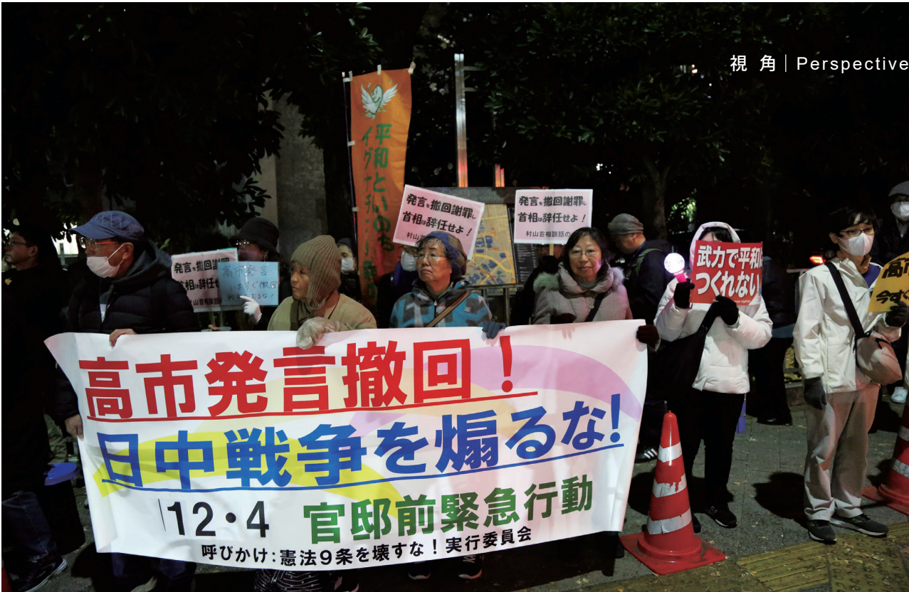
▲ 2025年12月4日晚，數百名日本民眾在位於東京的首相官邸前再度舉行集會，抗議日本首相高市早苗近期在國會發表的涉台錯誤言論，要求其撤回相關表態