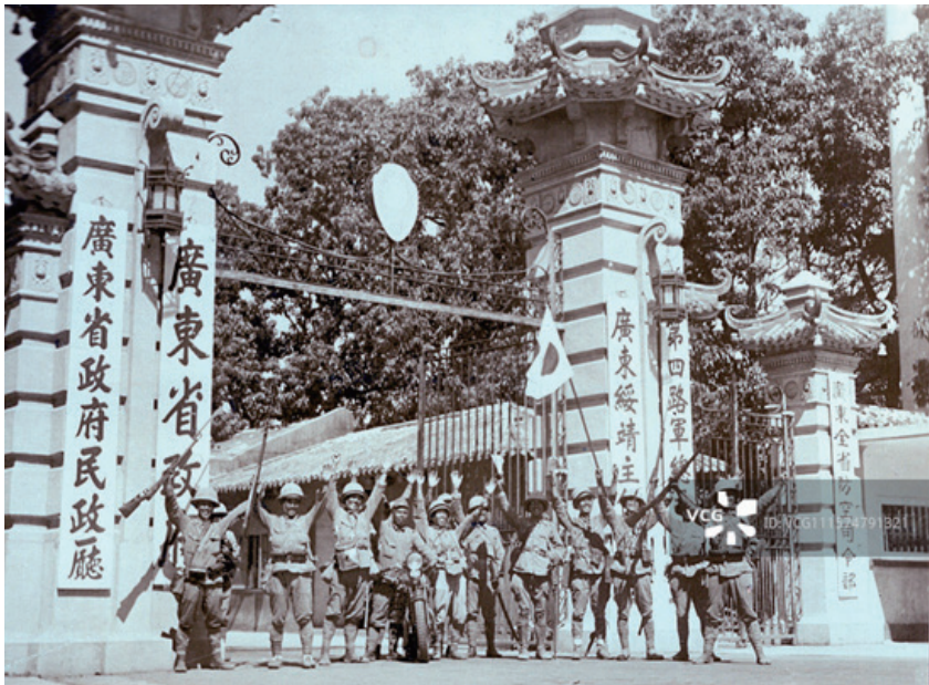
▲ 當年日本軍國主義正是以所謂「存亡危機事態」為幌子，悍然對外發動侵略戰爭。圖為1938年10月22日，日軍佔領廣州